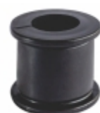
Luva Barra Estabilizadora Dianteira

Cód. Bradipar VW.08.0421.4 Cód. Original 600511421