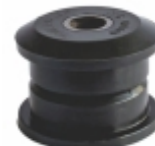
Bucha Barra Estabilizadora

Cód. Bradipar MB.08.4050.4 Cód. Original 970.168.40.50