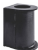
Luva Barra Estabilizadora Traseira

Cód. Bradipar VW.08.0041.4 Cód. Original 2T2.411.041