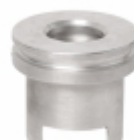
Pistão Caneca Trambulador

Cód. Bradipar MB.11.0011.4 Cód. Original 001.992.84.01