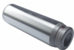
Pino Sapata (30x102mm) c/ Chanfro Original c/ Tratam.

Cód. Bradipar MB.15.5203.5 Cód. Original 301.420.00.39