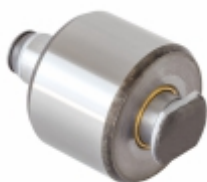
Reparo Parcial Patim de Freio Sem vedação (O'ring)

Cód. Bradipar MB.12.0003.4 Cód. Original 658.423.02.74