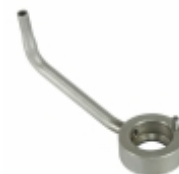
Bico Injetor de Óleo 4

Cód. Bradipar MB.10.0003.4 Cód. Original 457.180.14.43