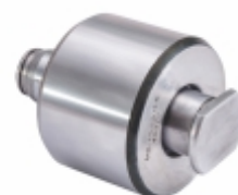
Reparo Parcial Patim de Freio Com vedação (O'ring)

Cód. Bradipar MB.15.5202.5 Cód. Original n/a