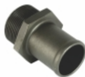
Conexão Roscada M30 x 1,5 comp. 54 mm

Cód. Bradipar MB.02.0000.4 Cód. Original 403.203.00.08