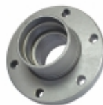
Cubo Polia Tensora Ventilador

Cód. Bradipar MB.71.0000.4 Cód. Original 343.053.70.27