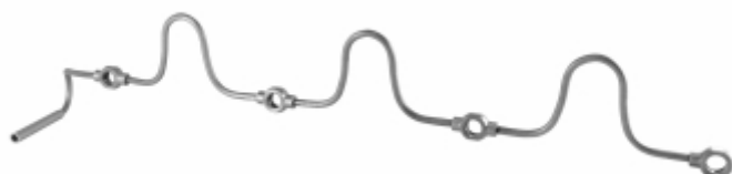
Cano Retorno Óleo Cabeçote

Cód. Bradipar SC.07.0051.4 Cód. Original 1528551