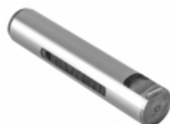
Pino Mola Com Fresa (25x126mm)

Cód. Bradipar FO.13.2501.4 Cód. Original n/a