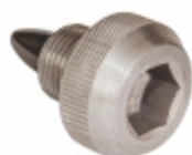
Bujão do Carter do Motor com Imã

Cód. Bradipar MB.04.0005.4 Cód. Original 000908.020004