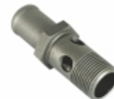
Conexão Roscada Ligaçao Bomba D'água

Cód. Bradipar MB.02.0001.4 Cód. Original 476.134.00.56