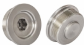
Bujão Cubo Redutor

Cód. Bradipar IV.09.0000.4 Cód. Original 5.801.385.944