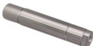
Eixo da Marcha Ré

Cód. Bradipar MB.06.0007.4 Cód. Original 679.254.01.06