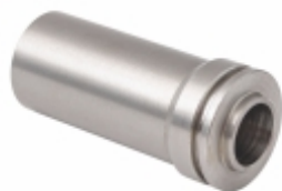
Pino da Pinça Curto

Cód. Bradipar MB.12.0004.4 Cód. Original 000.421.25.74