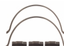
Kit Lamela Anel Sincronizado 3, 4 e 5 FSO4305