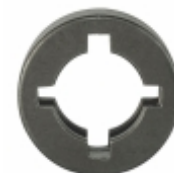
Anel Distanciador Rolamento Cubo Hélice

Cód. Bradipar SC.12.0016.4 Cód. Original 1.726.423