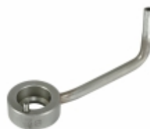
Bico Injetor de Óleo 7

Cód. Bradipar MB.10.0000.4 Cód. Original 407.180.06.84