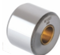
Rolete com Bucha de Bronze Ø Interno 23mm

Cód. Bradipar MB.15.5202.6 Cód. Original n/a