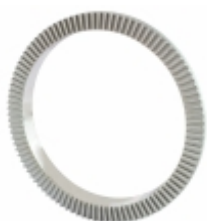
Anel do ABS 3013340315

Cód. Bradipar SC.12.0007.4 Cód. Original 1.362.721