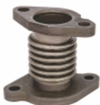
Tubo Sanfonado Trocador de Calor Válvula

Cód. Bradipar MB.98.0001.4 Cód. Original 912.145.05.00 / 912.045.00.53