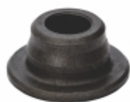
Prato da Mola

Cód. Bradipar MB.09.0005.4 Cód. Original 541.180.14.22