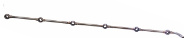
Tubo de Sangria Cabeçote

Cód. Bradipar MB.09.0002.4 Cód. Original 343.070.00.35