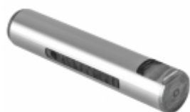
Pino Mola Com Fresa (25x140mm)

Cód. Bradipar FO.13.2503.4 Cód. Original TJG411175