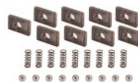
Jogo Pressorador Cx. Câmbio ZF S5420 S542/S5420SSO 5S580TO