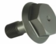
Parafuso Virabr (24x1,5x55) 8.8 Flange Sextavado 45

Cód. Bradipar MB.98.0005.4 Cód. Original 475.205.72.04