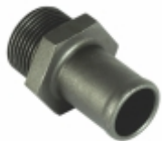
Conexão Roscada M22 x 1,5 comp. 44 mm

Cód. Bradipar MB.02.0003.4 Cód. Original 345.429.82.36