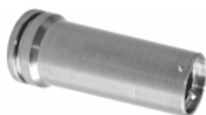
Pino Guia Pinça Freio Longo

Cód. Bradipar MB.12.0013.4 Cód. Original 001444.014216