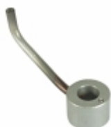
Bico Injetor de Óleo 6

Cód. Bradipar MB.10.0005.4 Cód. Original 460.180.04.43 460.180.08.43