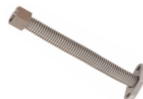
Tubo de Retorno (inox)

Cód. Bradipar SC.07.0007.4 Cód. Original 1.365.196