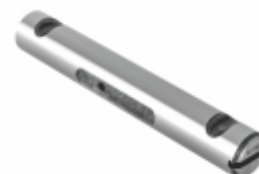
Pino Mola 170 mm

Cód. Bradipar FO.13.2502.4 Cód. Original TJG411173