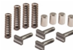
Jogo Pressorador Cx. Câmbio GRS01/R880/GRH880/GR900 GRH900/GRS890/GRS900 GRSH900 - SCANIA