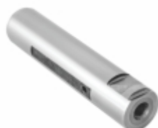
Pino Mola Com Fresa (30x146mm)

Cód. Bradipar MB.13.3001.4 Cód. Original 345.325.70.30