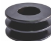
Polia Rígida Alternador

Cód. Bradipar MB.98.5825.4 Cód. Original 001.184.58.25 / 352.180.04.43