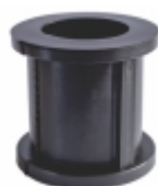
Bucha Superior Barra Estabilizadora Traseira

Cód. Bradipar VO.08.0455.4 Cód. Original 20587455