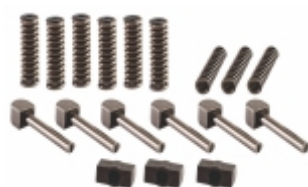
Reparo Trambulador Caixa Câmbio ZF 5S400 6S/6AS 1010