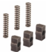
Jogo Pressorador Cx. Câmbio ZF 5S400 6S/6AS 1010