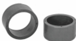
Bucha Lisa Garfo Embreagem

Cód. Bradipar MB.11.0010.4 Cód. Original 000.254.03.35