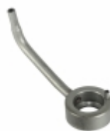
Bico Injetor de Óleo 3

Cód. Bradipar MB.10.0009.4 Cód. Original 352.180.01.43