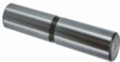
Pino da Balança 50 x 215 mm