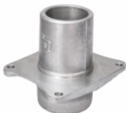
Corpo do Mancal do Ventilador

Cód. Bradipar MB.98.0006.4 Cód. Original 384.552.00.53