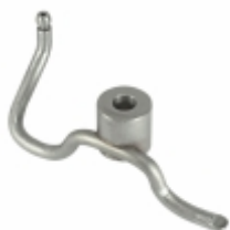
Bico Injetor de Óleo 1

Cód. Bradipar MB.10.0001.4 Cód. Original 427.180.00.43