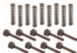
Jogo Pressorador Reparo Sincronizadores Caixa Câmbio ZF G60/85