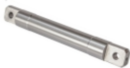
Eixo Garfo Embreagem 235mm

Cód. Bradipar MB.06.0006.4 Cód. Original 655.254.02.06