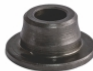
Prato da Mola

Cód. Bradipar SC.04.0002.4 Cód. Original 524.416