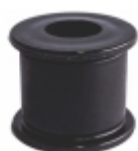
Luva Barra Estabilizadora Traseira

Cód. Bradipar VO.08.0833.4 Cód. Original 20.542.833