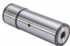
Pino Engrenagem Planetária Cubo

Cód. Bradipar MB.14.0000.4 Cód. Original 314.990.10.01