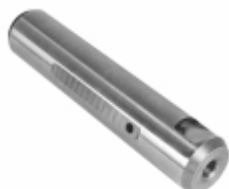
Pino Mola Sem Fresa (30x146mm)

Cód. Bradipar FO.13.2502.4 Cód. Original TJG411173