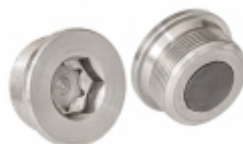
Bujão Carcaça Eixo Traseiro

Cód. Bradipar MB.13.0003.4 Cód. Original 389.325.02.30