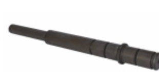
Eixo Trambulador/ Seletor Marcha

Cód. Bradipar SC.06.0364.4 Cód. Original 1.476.364