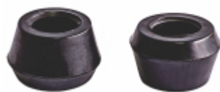
Bucha Amortecedor Dianteiro e Traseiro

Cód. Bradipar VW.08.0220.4 Cód. Original 2W0.411.041 A