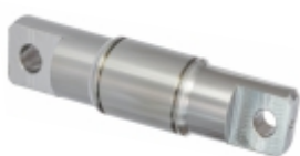
Eixo Garfo Embreagem

Cód. Bradipar MB.06.0006.4 Cód. Original 655.254.02.06