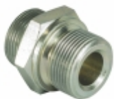
Conexão Roscada Encanamento 26x26

Cód. Bradipar MB.02.0003.4 Cód. Original 345.429.82.36