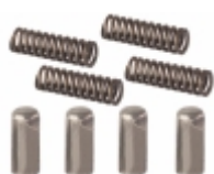
Kit Pino Interruptor Posição Neutra 1620/1622 1218/1725/1417/1418 1722/518/G