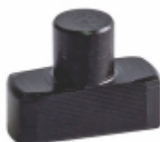
Sapata Garfo Diferente

Cód. Bradipar MB.98.0007.4 Cód. Original 475.205.70.05