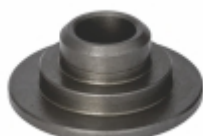
Prato da Mola

Cód. Bradipar SC.07.0003.4 Cód. Original 1.305.723