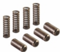
Jogo Pressorador Cx. Câmbio VT/VTO2214 2514/2814B – VOLVO