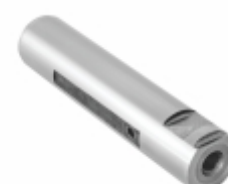
Pino Mola Com Fresa (25x117mm)

Cód. Bradipar MB.13.0004.4 Cód. Original 308.325.71.74