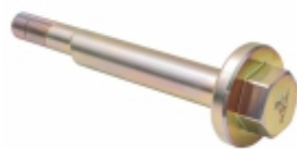
Pino Excêntrico Suspensão Pneumática