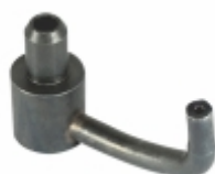
Bico Injetor de Óleo 8

Cód. Bradipar MB.10.0011.4 Cód. Original 611.180.00.43