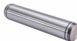
Pino Patim Freio

Cód. Bradipar MB.98.0008.6 Cód. Original 346.421.11.74