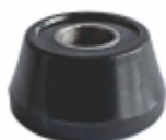
Bucha Olhal Barra Estabilizadora

Cód. Bradipar MB.08.7050.4 Cód. Original 384.320.70.50