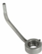
Bico Injetor de Óleo 5

Cód. Bradipar MB.10.0004.4 Cód. Original 460.180.00.43