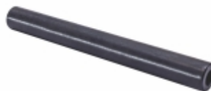
Eixo Pedal Embr. PGR

Cód. Bradipar SC.06.0625.4 Cód. Original 1.776.625