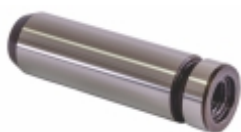
Pino Guia Seletora Caixa Câmbio

Cód. Bradipar SC.12.0008.4 Cód. Original 1324294