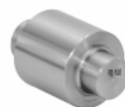
Rolete SAE 1020 Patim de Freio 18,86 x 32/35/38/41 mm

32 Cód. Bradipar VW.15.1932.4 32 Cód. Original 381.420.01.39 35 Cód. Bradipar VW.15.1935.4 35 Cód. Original 381.420.02.39 38 Cód. Bradipar VW.15.1938.4 38 Cód. Original 381.420.03.39 41 Cód. Bradipar VW.15.1941.4 41 Cód. Original 381.420.04.39