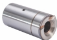
Eixo Engrenagem Planetária GR875, GRS895R

Cód. Bradipar SC.12.0014.4 Cód. Original 1.414.539