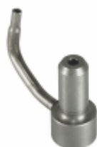
Bico Injetor de Óleo 11

Cód. Bradipar MB.10.0012.4 Cód. Original 457.180.09.43