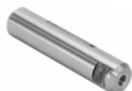
Pino Mola Sem Fresa (30x136mm)

Cód. Bradipar MB.13.3002.4 Cód. Original 389.325.02.30