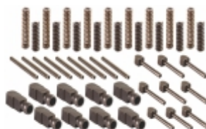
Jogo Pressorador Cx. Câmbio ZF S5-680 8S-1350/16S-1650