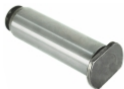
Pino Rolete Patim Freio Ar Traseiro 19x70mm (Sapatinha)

Cód. Bradipar MB.12.0003.4 Cód. Original 658.423.02.74