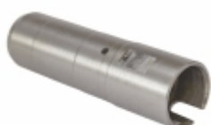
Luva do Injetor

Cód. Bradipar SC.07.0009.4 Cód. Original 1.857.052