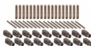
Jogo Pressorador Cx. Câmbio ZF 16S112/16S130 16S160/16SS190