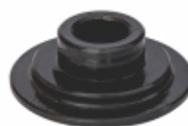
Prato da Mola

Cód. Bradipar SC.07.0004.4 Cód. Original 1.305.724