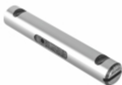
Pino Mola 158 mm

Cód. Bradipar FO.13.2502.4 Cód. Original TJG411173