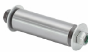
Kit Pino Sapata FR. (30x90 mm)

Cód. Bradipar MB.12.0001.4 Cód. Original 345.421.70.74-FF