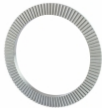
Anel do ABS 3073340115

Cód. Bradipar MB.03.0002.4 Cód. Original 301.334.03.15