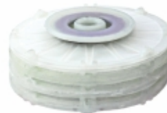
Filtro Óleo Radiador (Maracanã)

Cód. Bradipar SC.98.0007.4 Cód. Original 1.731.567 / 1.344.741