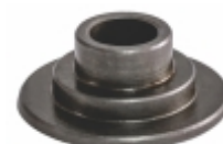
Prato da Mola

Cód. Bradipar SC.07.0050.4 Cód. Original 1528550