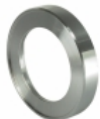
Anel Intermediário Pista Balança

Cód. Bradipar MB.02.0002.4 Cód. Original 9047.997.00.72