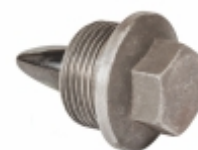
Bujão Magnético Caixa Câmbio

Cód. Bradipar SC.14.0002.4 Cód. Original 1.465.116