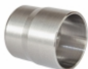
Luva do Cabeçote

Cód. Bradipar SC.07.0008.4 Cód. Original 1.865.117