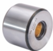
Rolete com Bucha de Bronze c/ O'ring - Ø Interno 23mm

Cód. Bradipar MB.15.5203.6 Cód. Original 301.420.00.39