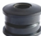
Bucha Barra Estabilizadora Dianteira

Cód. Bradipar SC.08.0110.4 Cód. Orig. 1.429.110/310.808