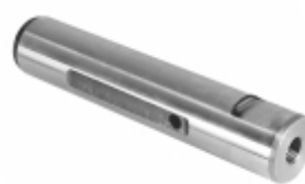
Pino Mola Sem Fresa (25x117mm)

Cód. Bradipar MB.13.0006.4 Cód. Original 345.325.70.30