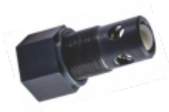
Válvula Alívio Filtro Óleo

Cód. Bradipar SC.98.0301.4 Cód. Original 301476