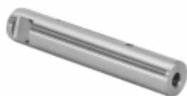
Pino Mola Sem Fresa (25x140mm)

Cód. Bradipar MB.13.0001.4 Cód. Original 345.322.70.30