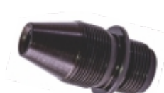
Luva Pinhão Velocímetro

Cód. Bradipar SC.15.0613.4 Cód. Original 332613