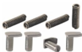
Jogo Pressorador Cx. Câmbio SR1400/SR1700 SR1900/SR2000/SR2400 SRO2000/SRO2400