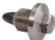
Bujão do Carter do Motor com Imã

Cód. Bradipar SC.04.0006.4 Cód. Original 1.423.608