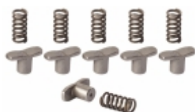
Jogo Pressorador Cx. Câmbio R1000/R1400/R1700 SR1400/SR1700/SR2000 SR2400/SRO2000 – VOLVO