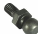
Pino Esférico Freio Motor

Cód. Bradipar SC.07.0005.4 Cód. Original 170.083