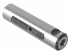
Pino Mola 110 mm

Cód. Bradipar FO.13.1901.4 Cód. Original n/a