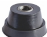
Bucha Olhal Barra Estabilizadora Dianteira

Cód. Bradipar SC.08.0496.4 Cód. Original 1.516.496