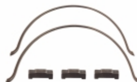
Kit Lamela Anel Sincronizado 1M, 2M FSO4305/FSO4405/FSO4505