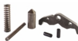
Reparo Trambulador Caixa Câmbio AXOR CÂMBIO G210 G240 COMPLETO