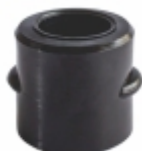
Luva Barra Estabilizadora Dianteira

Cód. Bradipar CA.08.8007.4 Cód. Original 8007