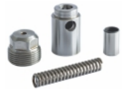
Kit Reparo Válvula Bomba de Óleo